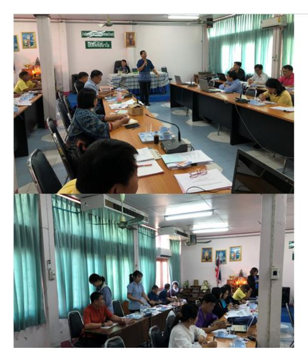
EB14.4 Link แสดงหลักฐานจากเว็บไซต์ของหน่วยงาน ในระบบMITAS