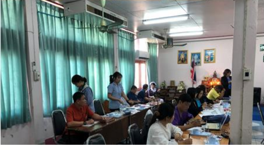
EB14.4 Link แสดงหลักฐานจากเว็บไซต์ของหน่วยงาน ในระบบMITAS