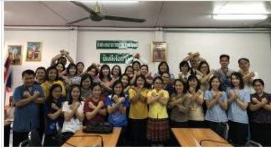
สภา จังหวัดน่าน